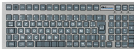
S99C TASTIERA A MEMBRANA 99 TASTI