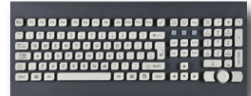
K105B-W TASTIERA IN SILICONE 105 TASTI DA PANNELLO