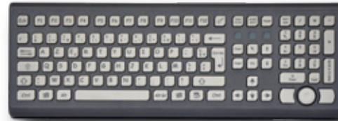
K105B-T TASTIERA IN SILICONE 105 TASTI IN CONTENITORE DA TAVOLO