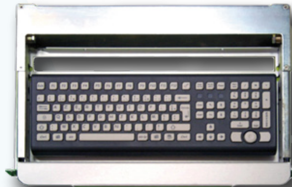
K105B-E TASTIERA IN SILICONE 105 TASTI IN CASSETTO ESTRAIBILE DA 19" 1U